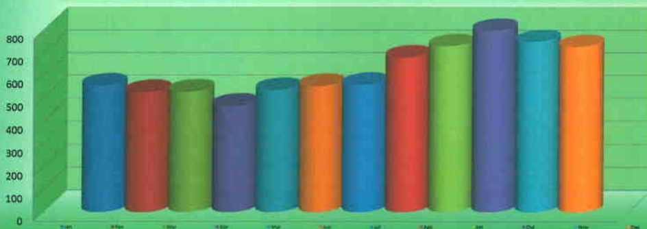
Pacientes Internados Dia - 2012